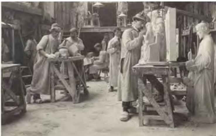
ATELIER ALOÏS DE BEULE AAN DE NIEUWBRUGKAAI

Wie ook aan de 'beeldendecoratie' van het Postgebouw had meegewerkt was Hippolyte Le Roy (1857-1943). Le Roy was, zoals Verbanck, afgestudeerd aan de Gentse Academie en hij had vergulde bronzen beelden (allegorische figuren en duiven met gestrekte vlerken) vervaardigd die de dakconstructie van het Postgebouw sierden. Deze werden echter tijdens de Eerste Wereldoorlog door de 'Duitsers' weggenomen om omgesmolten te worden tot oorlogstuig. Nog bestaand werk van Hippolyte Le Roy treffen we aan in de Veldstraat.