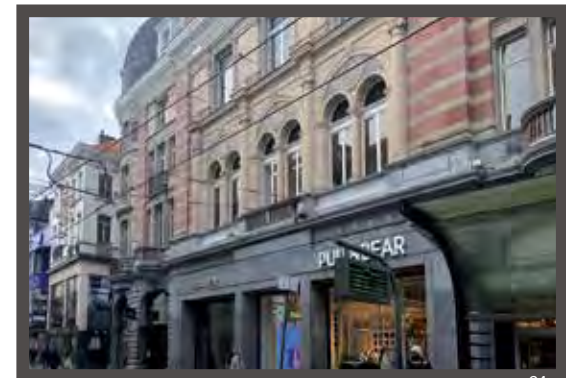
..... VELDSTRAAT 18