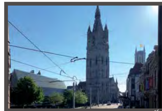
>>>> EMILE BRAUNPLEIN