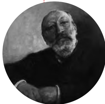
CHARLES VAN RYSSELBERGHE

Charles Van Rysselberghe (1850-1920) was namelijk stadsarchitect tussen 1879 en 1916 en in die functie was hij onder meer medeverantwoordelijk voor de restauratie van de Lakenhalle. Na heftige discussies werd toen besloten de Lakenhalle zoals ze gepland was in de eerste helft van de 15 de eeuw te reconstrueren, wat in de praktijk betekende dat er in 1903 vier traveeën werden toegevoegd aan de noordzijde. Door ze zoveel eeuwen later op te bouwen in wat we enkel maar kunnen omschrijven als 'namaakgotiek' volgde men de restauratievisie van de Fransman Eugène Viollet-le-Duc die stelde dat 'restaureren het herscheppen van een gebouw is in een toestand die wellicht nooit heeft bestaan'. Naast restaurateur in de toenmalige betekenis van het woord was Van Rysselberghe als stadsarchitect verantwoordelijk voor tal van nieuwbouw binnen de stad, waarbij hij vooral gebruik maakte van neostijlen, specifiek van het neoclassicisme en de neorenaissance. Zijn magnum opus werd de creatie van het Museum voor Schone Kunsten in neoclassicistische stijl aan de rand van het Citadelpark. Tevens werd Charles Van Rysselberghe aangezocht om de restauratie van het Belfort op zich te nemen, specifiek het plaatsen hierop van een nieuwe torenbekroning.