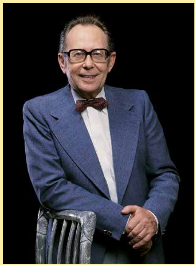
Morris © Lucky Comics

“Begraaf mij met potlood en papier” was geen loze boutade van Morris, alias Maurice De Bevere. Voor deze autodidact bij uitstek is tekenen immers levenslang de enige ambitie geweest. Via vooroorlogse stripbladen als Robinson en Mickey Mouse Weekly en de eerste albums van Hergé, wiens Tintin au pays des Soviets hij, naar eigen zeggen, meermaals kopieerde kreeg hij de smaak te pakken. Als 11-jarige leerde hij van een karikaturist, die op de zeedijk zijn vaardigheden demonstreerde, de eerste knepen van deze boeiende discipline, die hij later op college stiekem perfectioneerde met leraars en surveillanten als model. Wist hij veel dat die portretten later nog voor de gezichten van de doodgravers in zijn Lucky Luke verhalen zouden dienen. Als speelgoed kreeg hij ooit een projectietoestel Pathé-Baby waarmee hij (teken)filmpjes kon afspelen en beeld voor beeld de beweging ontleden, iets wat hem buitengewoon fascineerde. Eenmaal zijn studies beëindigd heeft hij slechts één toekomstdroom: tekenfilms maken. Een eerste stap in die richting is de schriftelijke cursus van Jean Image die de grondregels van de animatietechniek aanleert. Met die bagage kan hij aan het werk als inker in de C.B.A.-studio van Paul Nagant die eigen Belgische tekenfilms wil produceren. In die periode ontwerpt hij ook het