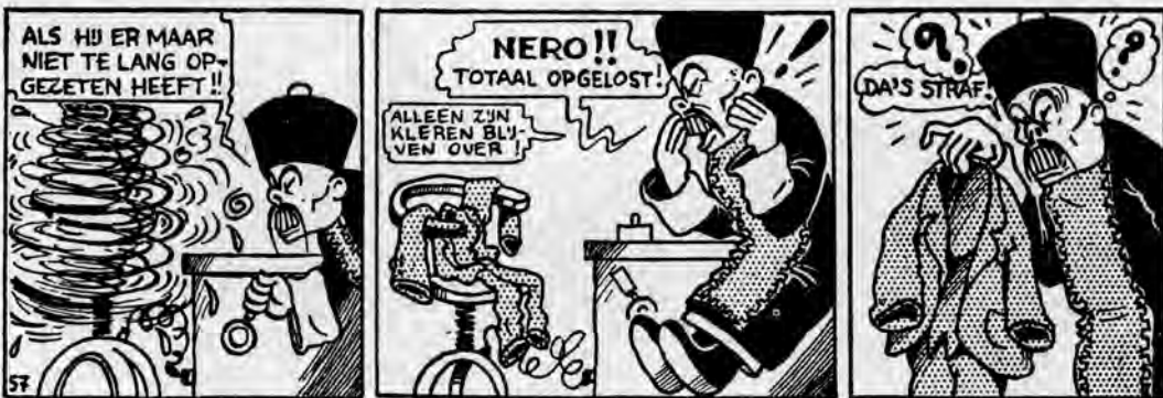
Het B-Gevaar, 1948 – strook 5.