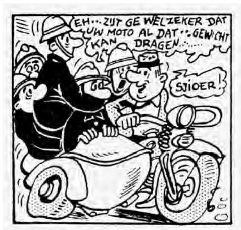
Het Geheim van Matsuoka, 1947-1948 – strook 144/3.

Dan is er ook nog het (getekend) decor, van ongere straatjes, krochten en steegjes, de stedelijke monumenten van Gent en Brugge, wat toch de opmerking staaft dat in de drie belangrijkste krantenstrips van die jaren (Suske en Wiske in De Standaard , Van Zwam in De Nieuwe Gids en Thomas Pips in Het Volk ), het stedelijk decor – Antwerpen, Brussel, Gent, etc – wel heel belangrijk was. Dat verdient een studie apart. Avis aux amateurs...