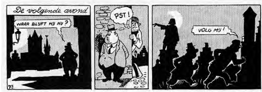
Het Geheim van Matsuoka, 1947-1948 – strook 75.

Dan is er ook nog het (getekend) decor, van ongere straatjes, krochten en steegjes, de stedelijke monumenten van Gent en Brugge, wat toch de opmerking staaft dat in de drie belangrijkste krantenstrips van die jaren (Suske en Wiske in De Standaard , Van Zwam in De Nieuwe Gids en Thomas Pips in Het Volk ), het stedelijk decor – Antwerpen, Brussel, Gent, etc – wel heel belangrijk was. Dat verdient een studie apart. Avis aux amateurs...