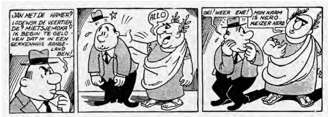
Het Geheim van Matsuoka, 1947-1948 – strook 9.

Het tafereeltje in het commissariaat wordt een motief dat we als terugkerende sekvens in latere verhalen makkelijk zullen herkennen (o.a. de eindsekvens van De ark van Nero ), net als we Marc Sleen, de auteur himself, meermaals zien interveniëren in het verhaal.