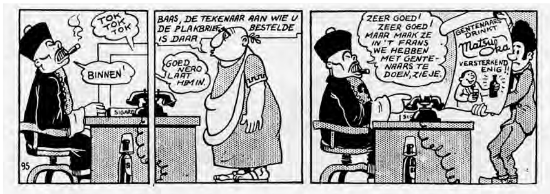
Het Geheim van Matsuoka, 1947-1948 – strook 95.

Belangrijk is ook het geografisch element, want al begint het verhaal in Brussel, de actie verplaatst zich naar Gent en nadien zelfs naar Brugge.