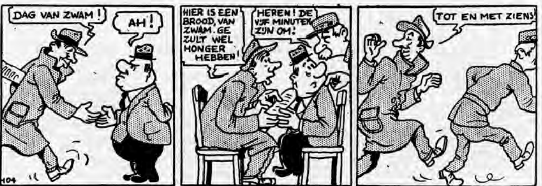
Het Geheim van Matsuoka, 1947-1948 – strook 101 tot 104.